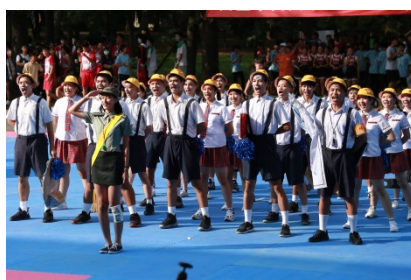
108 學年度啦啦隊競賽冠軍