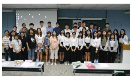
大學部小論文比賽