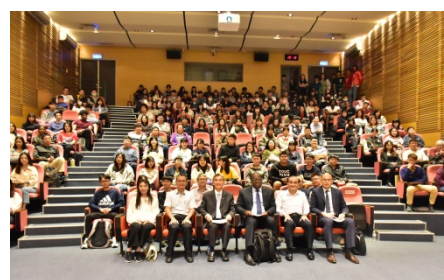
WTO 農業處 Edwini Kessie 處長演講

電話：04-22840350 傳真：04-22860255 網址： http://nchuae.nchu.edu.tw/ Email: nchuae@nchu.edu.tw