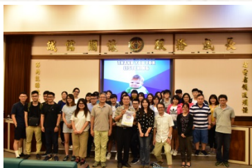
碩士班課程企業參訪