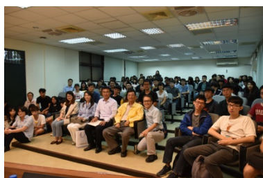
農委會陳吉仲主委演講