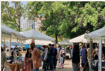
小蝸牛市集，已成為國內知名「地方創生企業」。