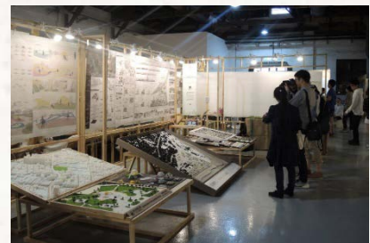
景觀新秀展-畢業設計十一校聯展