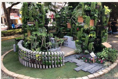
2019 全國青年景觀競賽榮獲第三名