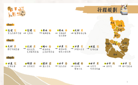
第九屆「城鄉旅遊·綠色饗宴」旅遊行程設計全國競賽榮獲第一名