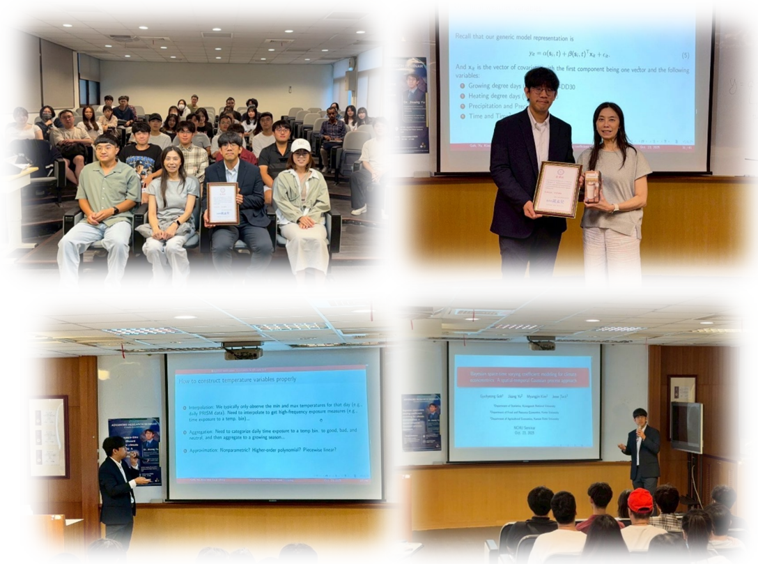
圖 10：114/10/23 活動講座側拍記錄