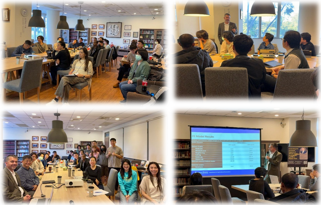
圖 11：114/12/09 活動講座側拍記錄