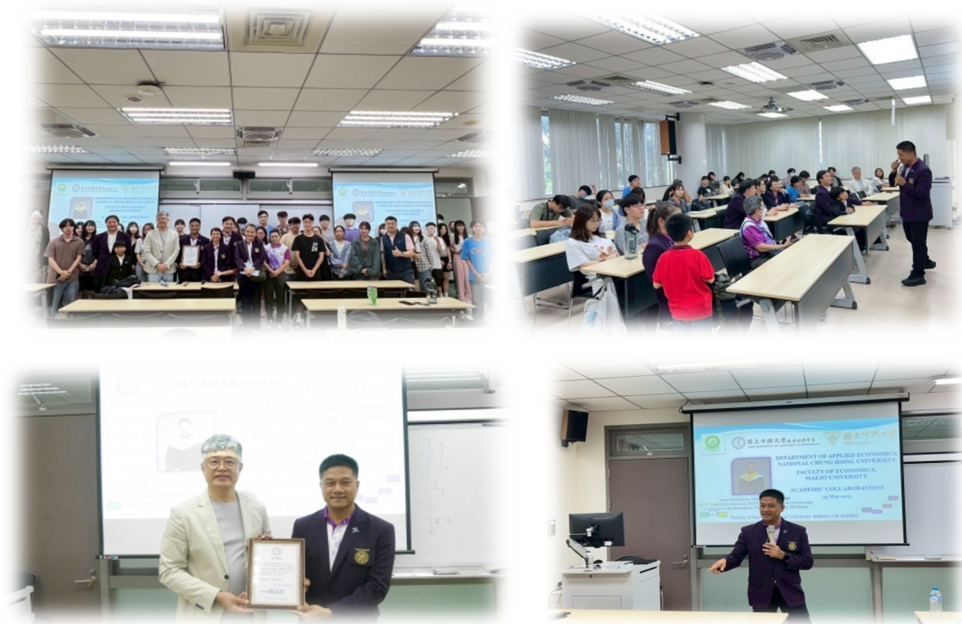
圖 6：114/05/29 活動講座側拍記錄