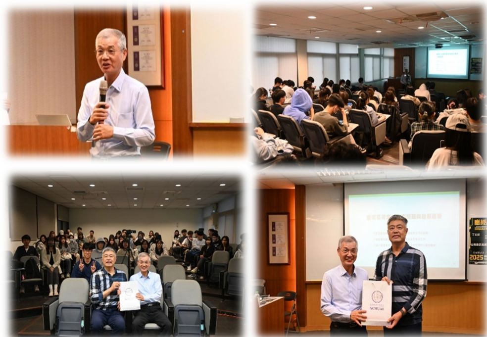
圖 1：114/03/13 活動講座側拍記錄