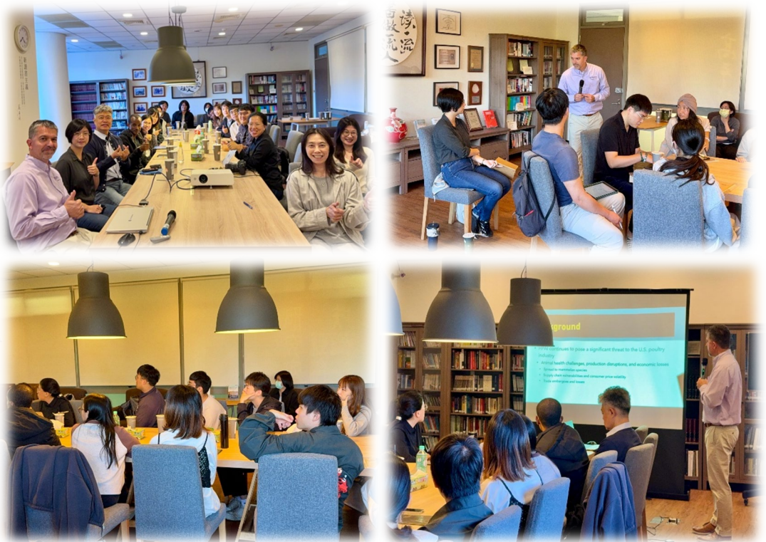
圖 11：114/12/10 活動講座側拍記錄