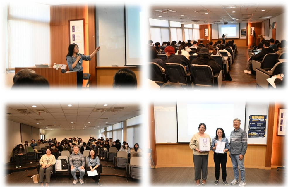
圖 2：114/03/20 活動講座側拍記錄