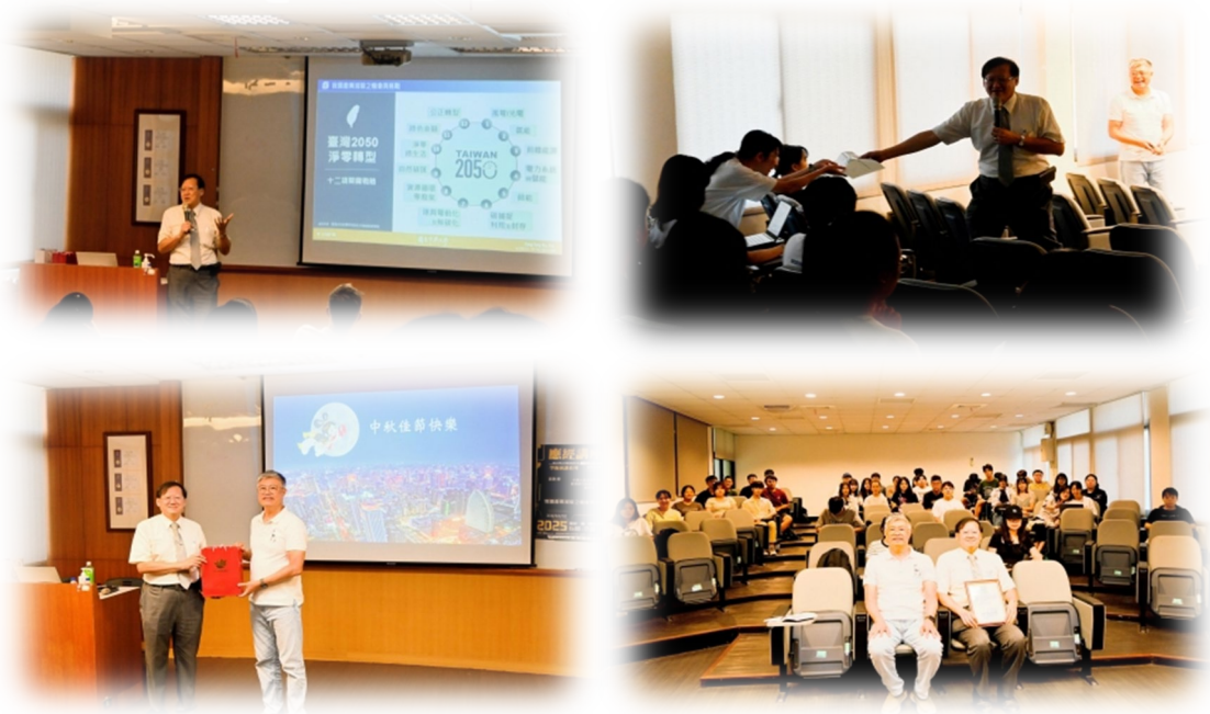
圖 8：114/10/02 活動講座側拍記錄