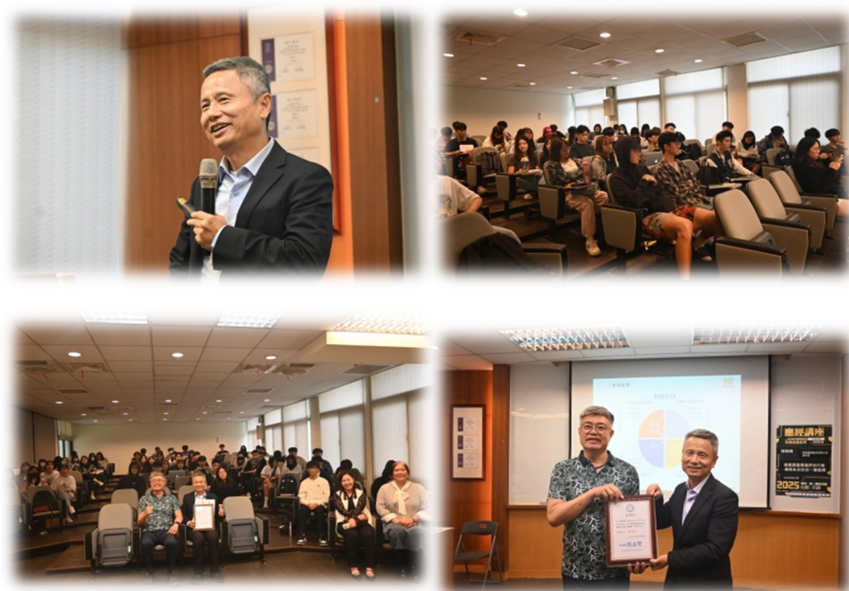
圖 3：114/04/10 活動講座側拍記錄