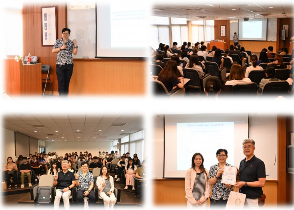
圖 4：114/05/22 活動講座側拍記錄