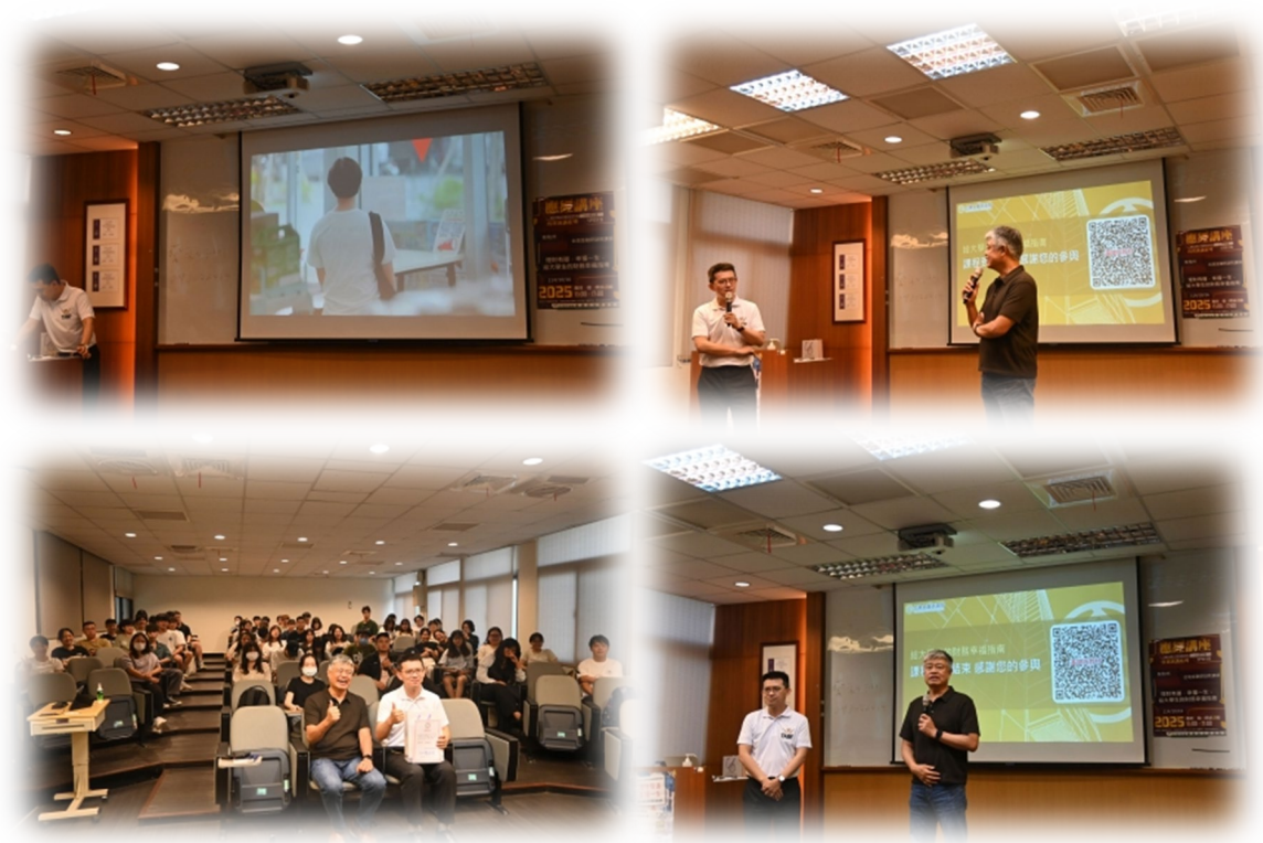
圖 9：114/10/16 活動講座側拍記錄