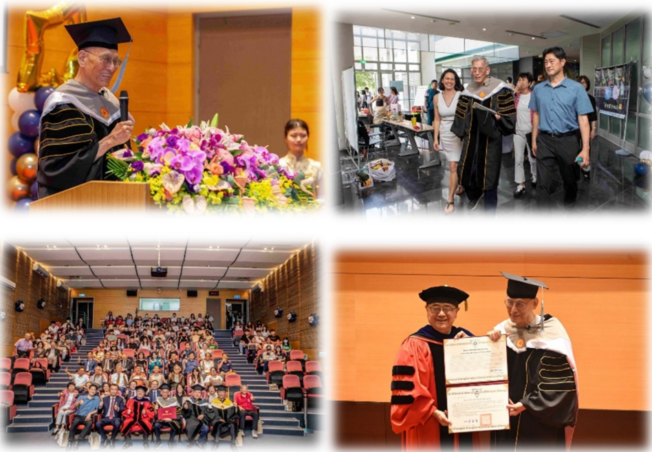
圖 5：114/05/23 活動講座側拍記錄