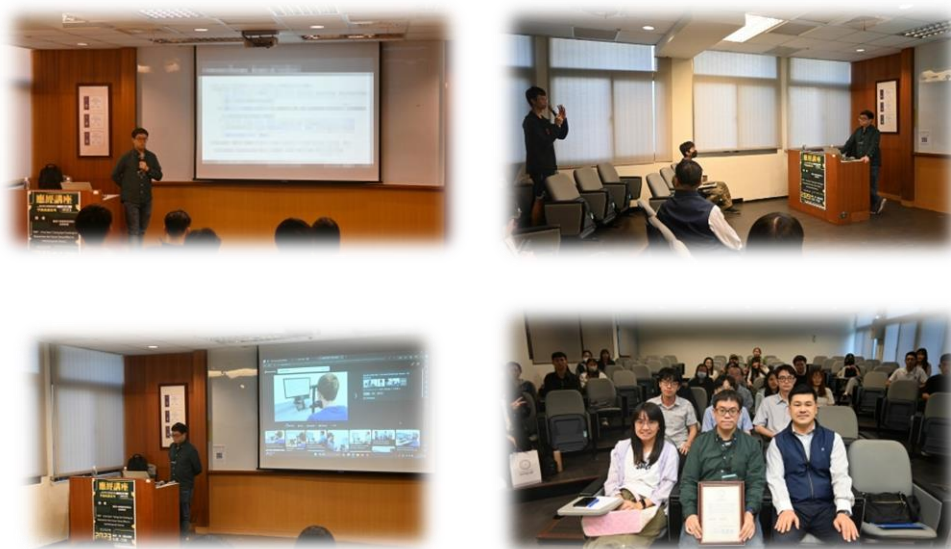
圖 5：112/12/14 活動講座側拍記錄