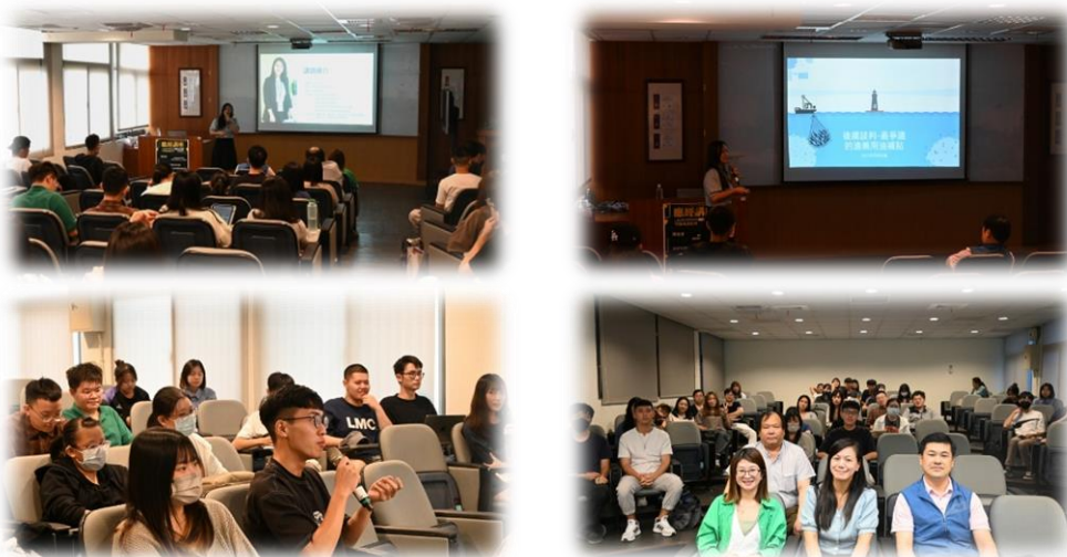
圖 3：112/10/19 活動講座側拍記錄