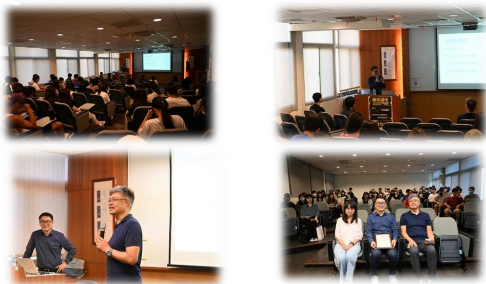
圖 2：112/10/12 活動講座側拍記錄