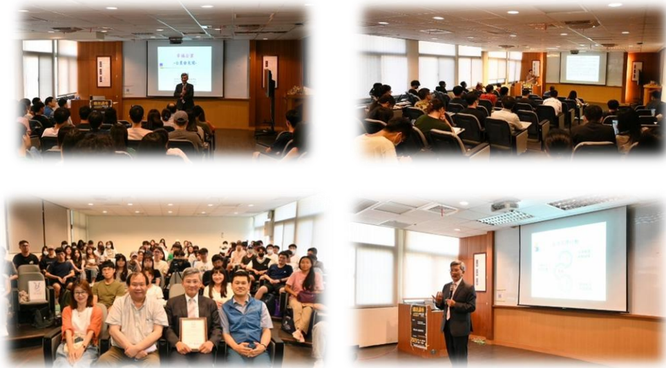
圖 1：112/09/14 活動講座側拍記錄