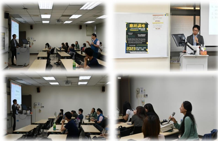
圖 4：112/11/02 活動講座側拍記錄 來源：取自國立中興大學 應用經濟學系 活動相簿