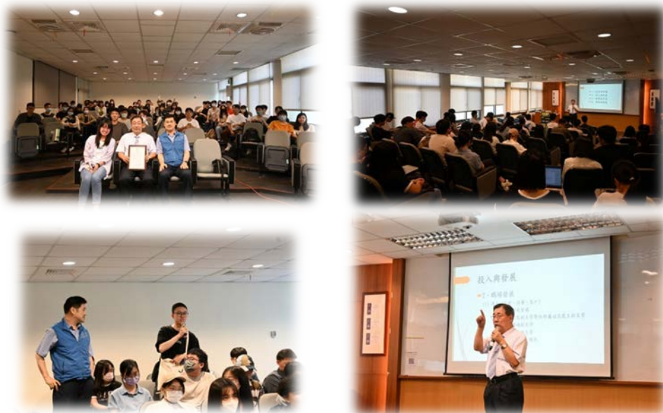
圖 5：112/05/25 活動講座側拍記錄