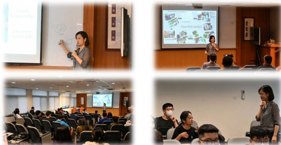
圖 3：111/04/20 活動講座側拍記錄