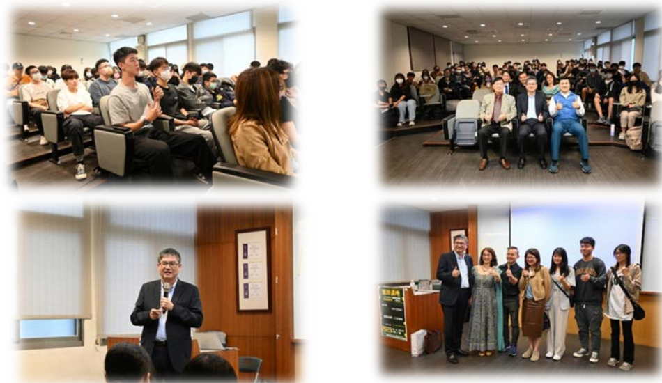
圖 2：112/03/30 活動講座側拍記錄