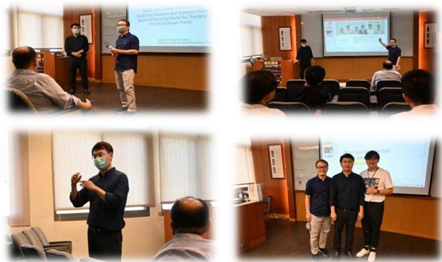
圖 6：112/06/01 活動講座側拍記錄