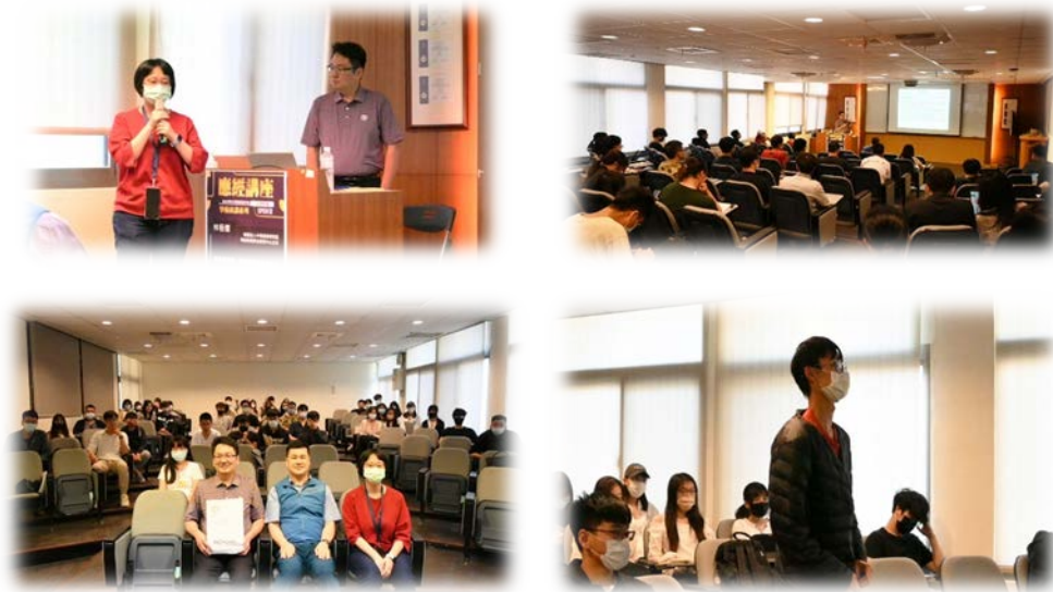
圖 1：112/03/23 活動講座側拍記錄