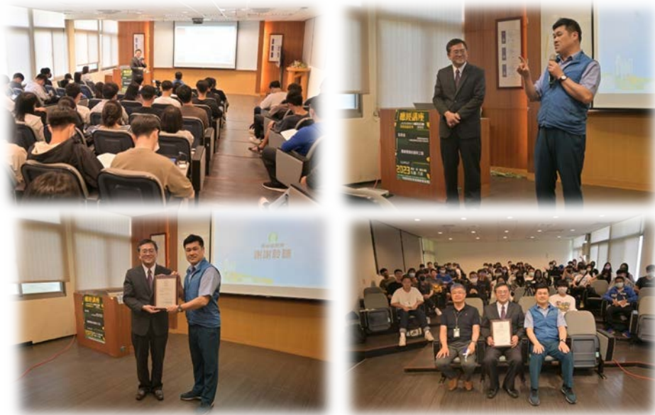
圖 4：112/04/27 活動講座側拍記錄