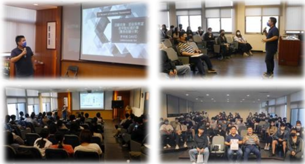
圖 2：111/10/20 活動講座側拍記錄