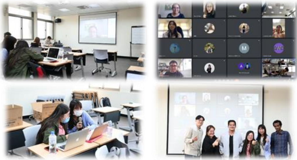
圖 3：111/10/24 活動講座側拍記錄