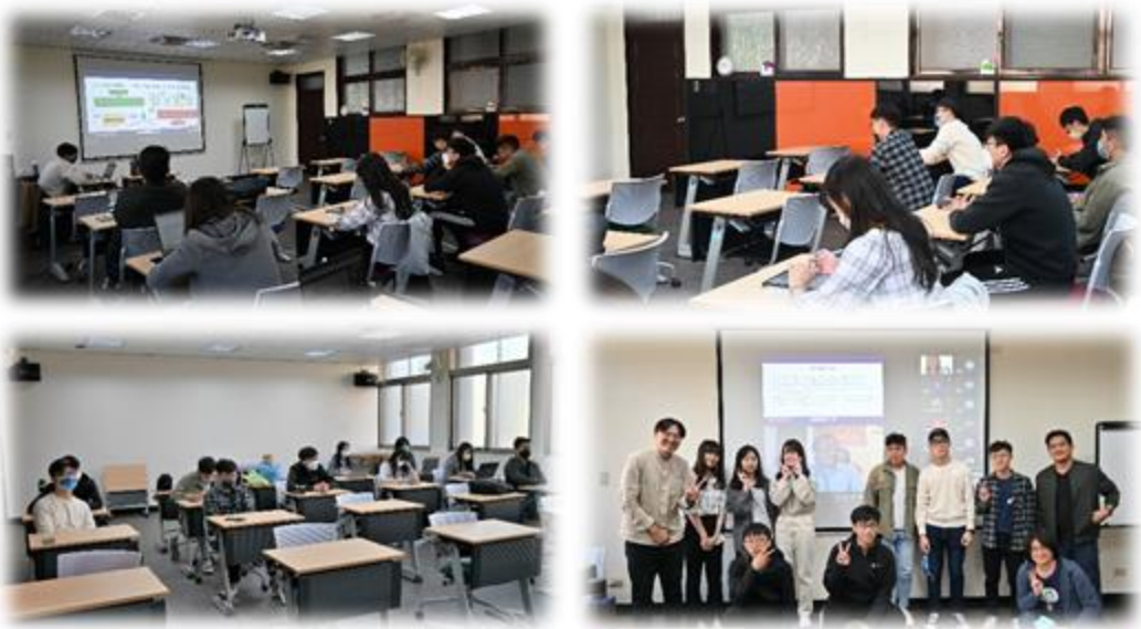
圖 11：111/12/09 活動講座側拍記錄