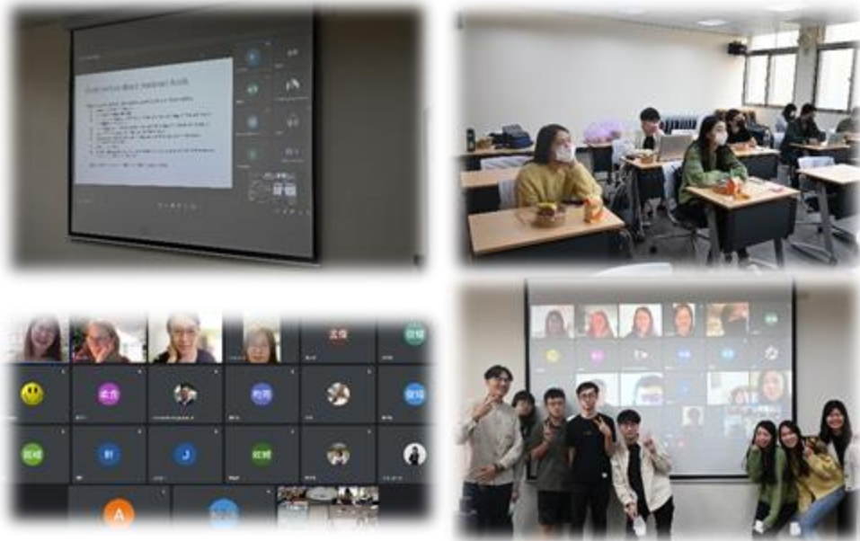
圖 6：111/11/11 活動講座側拍記錄