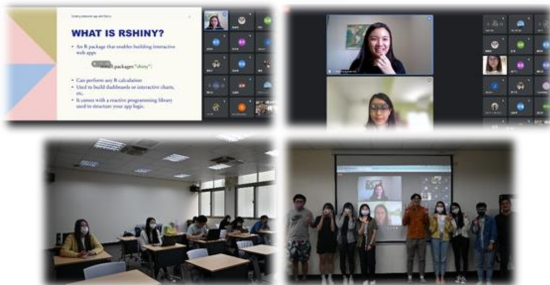
圖 9：111/11/25 活動講座側拍記錄