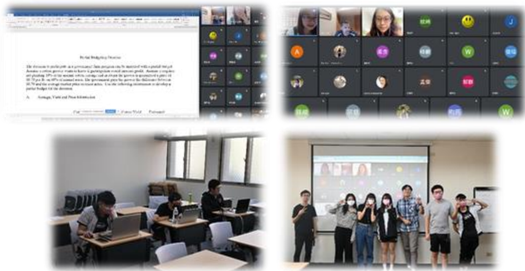
圖 7：111/11/18 活動講座側拍記錄