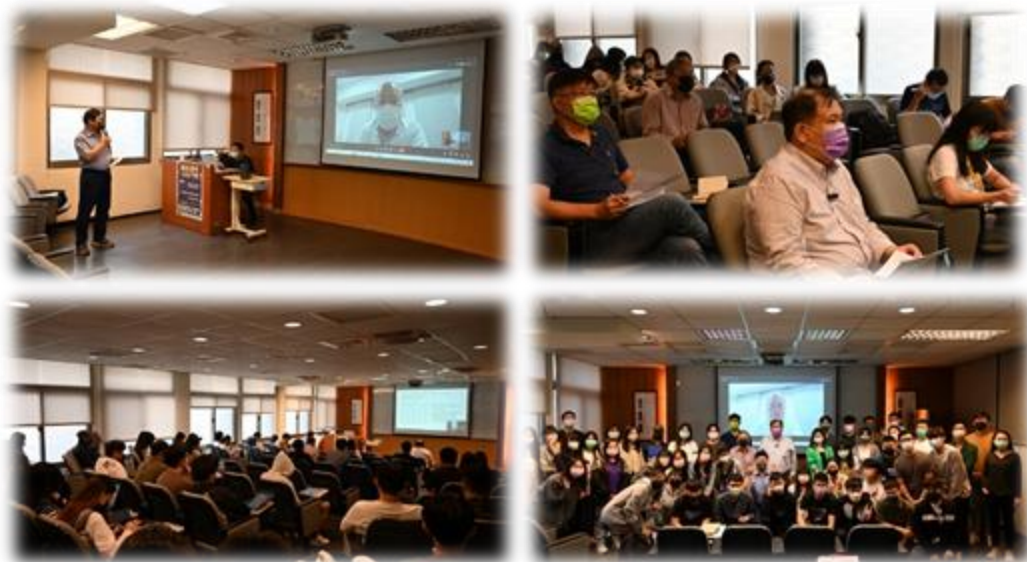
圖 8：111/11/24 活動講座側拍記錄