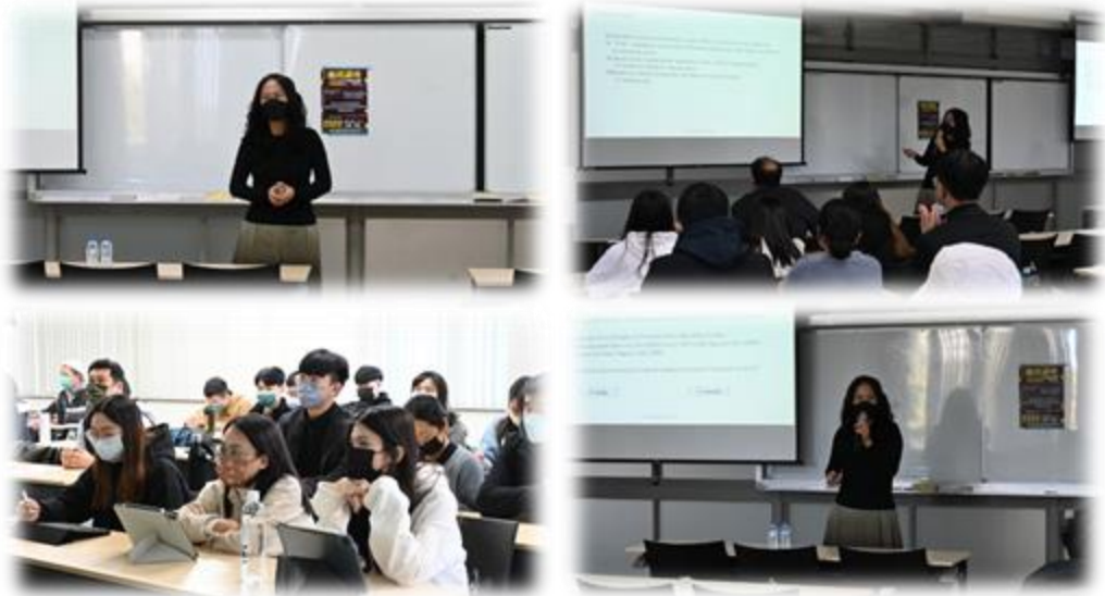
圖 12：111/12/19 活動講座側拍記錄