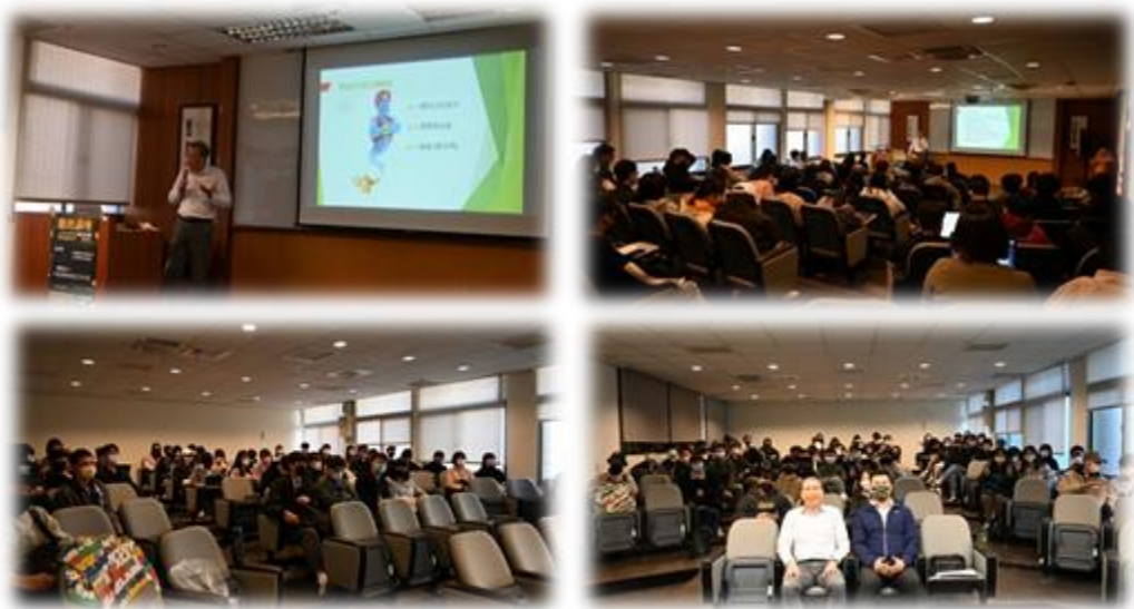
圖 13：111/12/22 活動講座側拍記錄