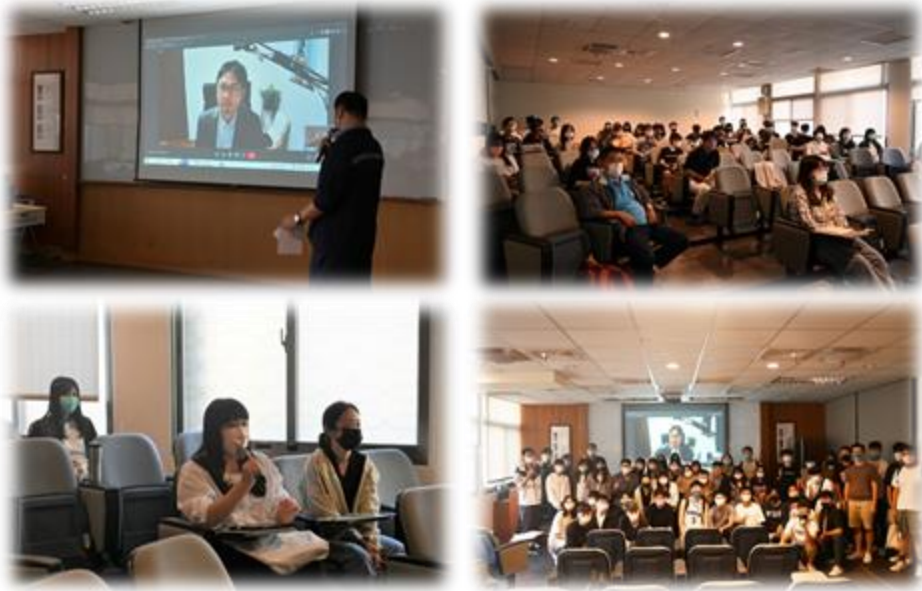
圖 5：111/11/10 活動講座側拍記錄