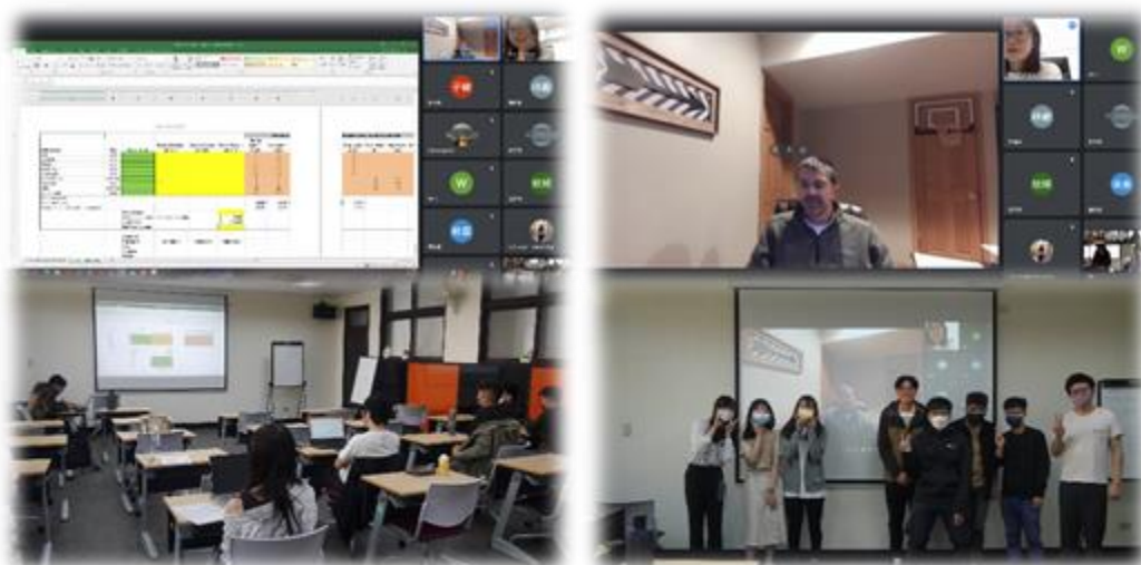
圖 10：111/12/02 活動講座側拍記錄